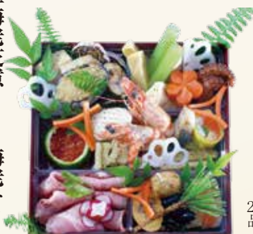
重箱サイズ 19.5cm × 19.5cm × 7cm

車海老芝煮 天然とこぶし 海老松風 竹の子 青路踏 花人參 湯葉巻 たこ蒸し煮 子持ち鮎 のどぐろ綿糸巻 花蓮根 たたき牛蒡 つくね串