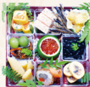
重箱サイズ 19.5cm × 19.5cm × 7cm

車海老姿煮 子持ち鮎 子持ち昆布 いか松笠白焼 つくね串 うずら玉子串 笹麩茶巾 竹の子 青路 湯葉巻 花人參 たたき牛蒡 たこ蒸し煮 花蓮根